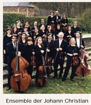
Ensemble der Johann Christian Bach-Akademie